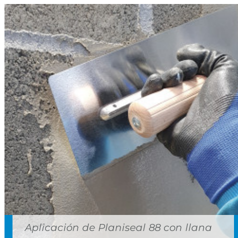
Aplicación de Planiseal 88 con llana