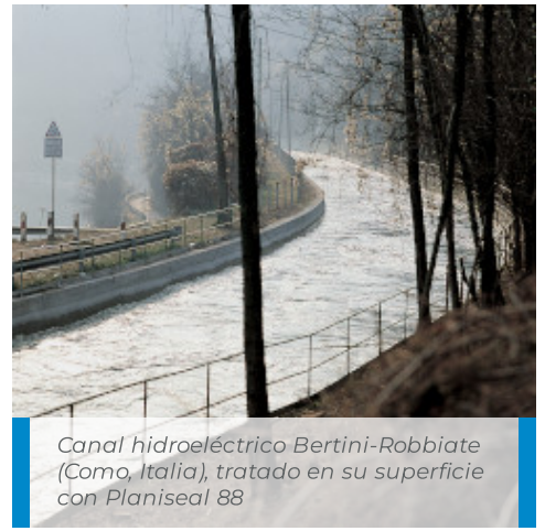
Canal hidroeléctrico Bertini-Robbiate (Como, Italia), tratado en su superficie con Planiseal 88