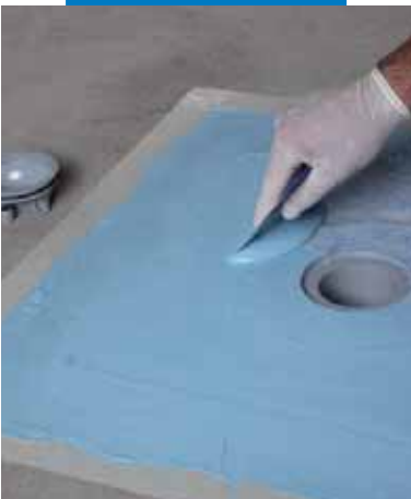
Sujeción del tejido de Drain Vertical con Mapelastic® AquaDefense