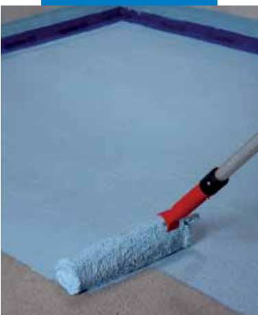
Aplicación de la primera capa de Mapelastic® AquaDefense sobre un recocado

Mapelastic® AquaDefense es resistente al agua, al agua de cal (ph > 12), al agua que contiene cloro y a los detergentes de uso común.