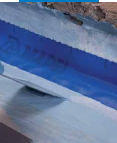
Aplicación de Mapeband en la unión pared-pavimento con Mapelastic® AquaDefense