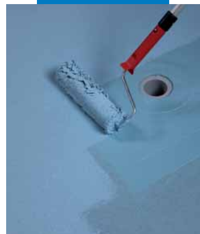
Aplicación con rodillo de la segunda capa de Mapelastic® AquaDefense