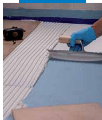
Encolado de baldosas sobre Mapelastic® AquaDefense

Valores de adherencia según la EN 14891 determinados con Mapelastic® AquaDefense y adhesivo cementoso tipo C2 de acuerdo con la EN 12004