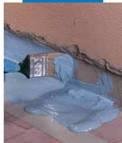
Aplicación con brocha de Mapelastic® AquaDefense en la unión pared-pavimento, antes de la aplicación de Mapeband